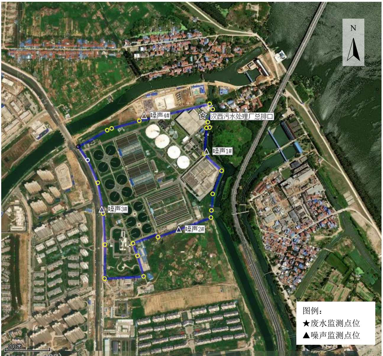
附图 1：现场监测点位图