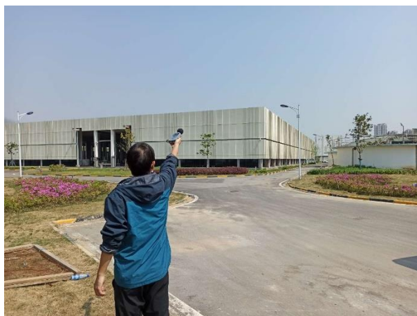
厂界 4#噪声监测点 (▲4)