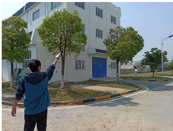
厂界 2#噪声监测点 (▲2)