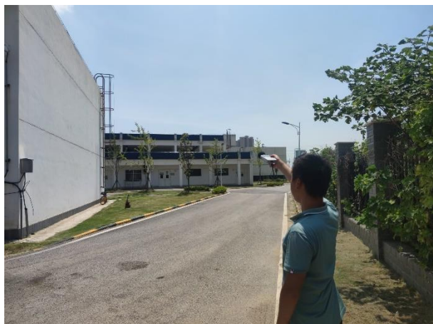
厂界 1#噪声监测点 (▲1)