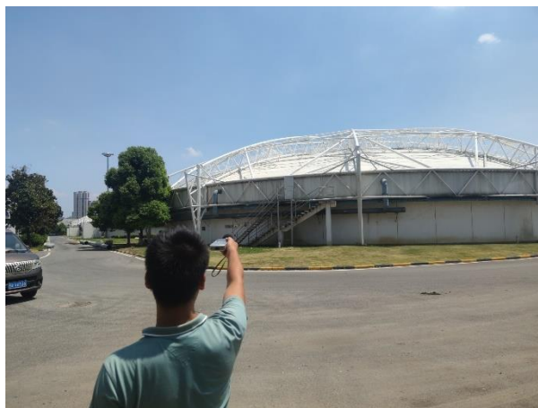
厂界 2#噪声监测点 (▲2)