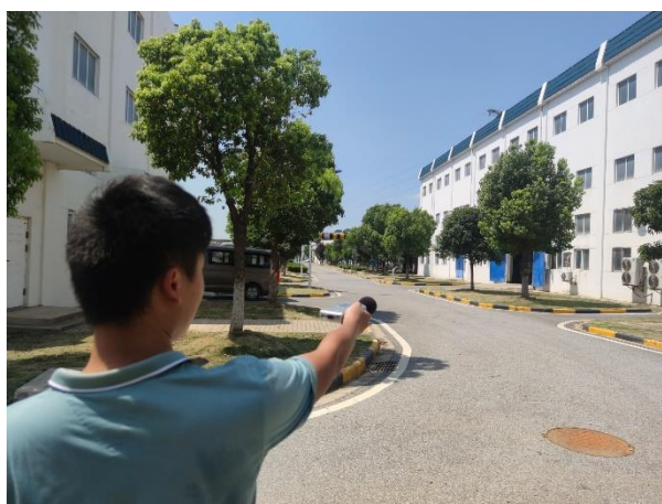
厂界 4#噪声监测点 (▲4)