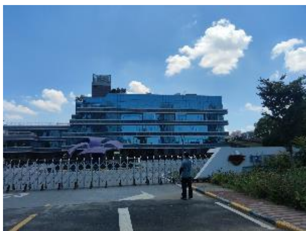
厂界 3#噪声监测点 (▲3)