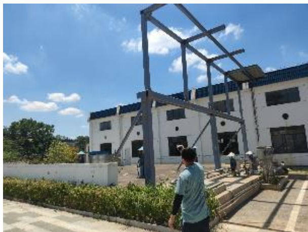
厂界 1#噪声监测点 (▲1)