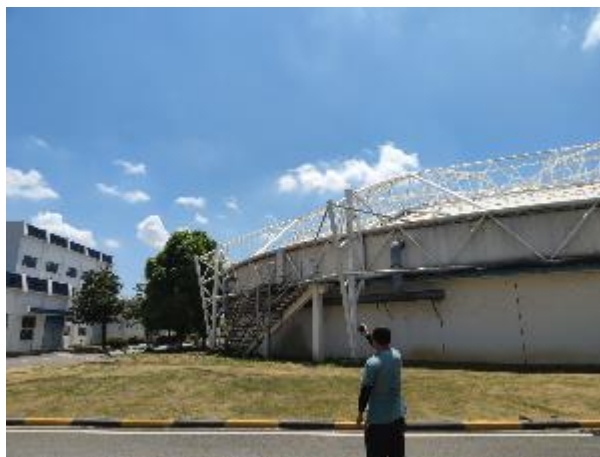
厂界 2#噪声监测点 (▲2)