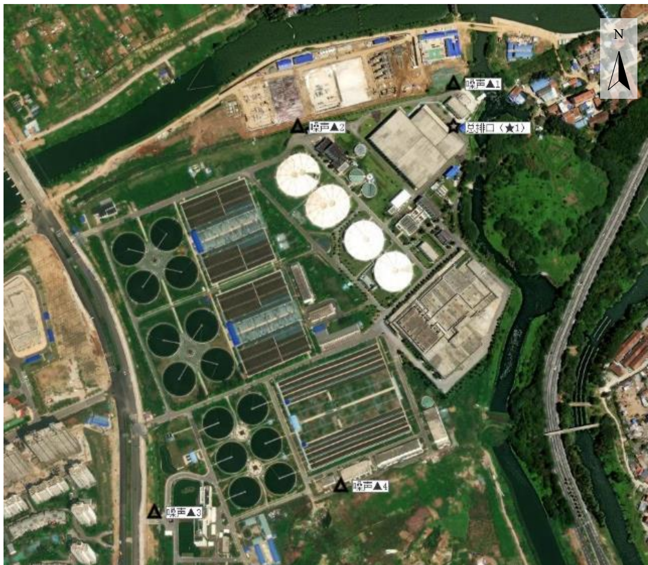
附图 1：现场监测点位图