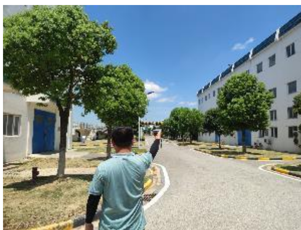
厂界 4#噪声监测点 (▲4)