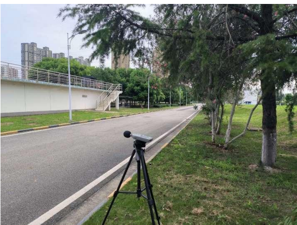
厂界 4#（▲4）噪声监测点位