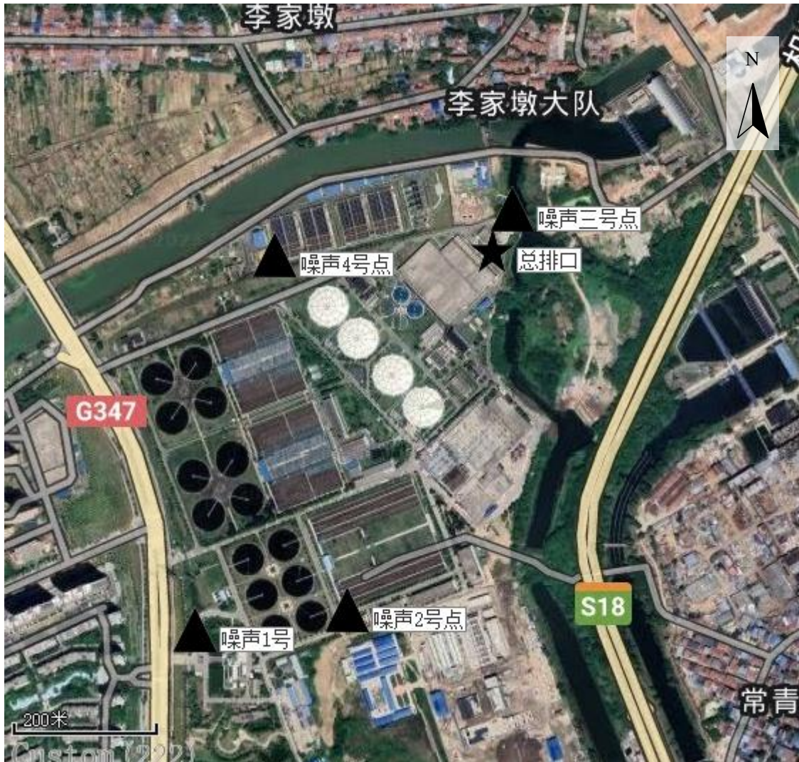
附图 1：现场监测点位图