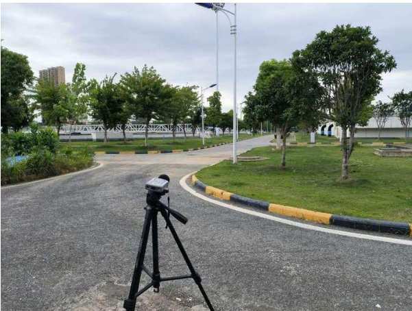
厂界 2#（▲2）噪声监测点位