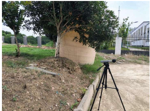
厂界 3#（▲3）噪声监测点位