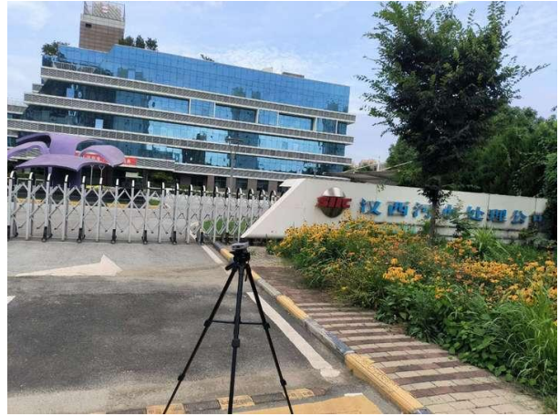
厂界 1#（▲1）噪声监测点位